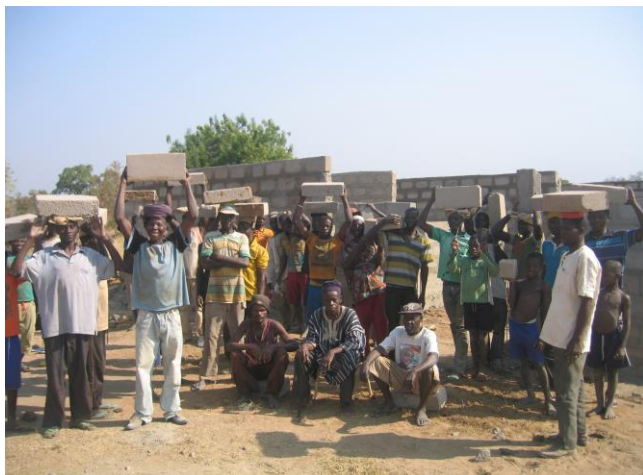
Bouwactiviteiten onderwijzerswoning Tuvuu.

De bouw van de onderwijzerswoningen in Tuvuu loopt eveneens voorspoedig. In dit onderkomen kunnen straks totaal 6 onderwijzers worden gehuisvest. Zij hebben dan elk de beschikking over een keukentje, wasruimte, slaapkamer en woonkamer. Natuurlijk gebeurt er veel gezamenlijk op de binnenplaats en daar is ook alle ruimte voor. Deze huisvesting is een welkome aanwinst voor het ministerie van onderwijs en deze kunnen nu gemotiveerde onderwijzers huisvesten in dit afgelegen gebied. Dit is het 3 de dorp waar we in staat zijn geweest deze accommodaties te laten bouwen.