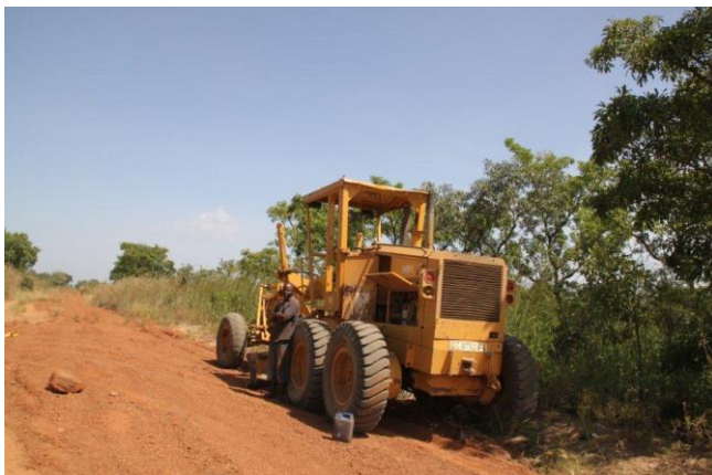
De grader welke dagelijks bezig is de wegen begaanbaar te maken.

Er is ook vooruitgang met het onderhoud aan de gravel- en zandwegen. De wegen worden nu regelmatig gladgeschoven door een grader. Dit is al een hele vooruitgang. Het betekent dat in het regenseizoen nog niet alle dorpen bereikbaar zijn met een 4 wiel aangedreven auto, maar met "bush proof" motorfietsen is dat wel mogelijk. Ook dit is al een reuze vooruitgang.