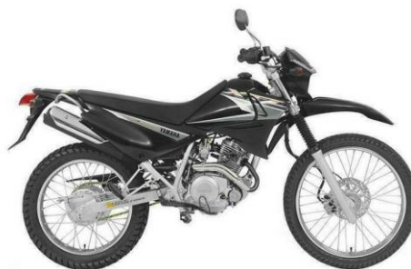
Deze motor werd aangeschaft.

Mede dankzij ondersteuning van Lions club "de Bernisse" hebben we ook nog een Yamaha XTZ, 125 cc motorfiets kunnen aanschaffen, die is zeer geschikt is om in de bush te rijden. Een ieder is er van overtuigd dat dit een enorme verbetering is omdat dit de noodzakelijke medische zorg kan brengen waar dat nodig is. Kortom, we zijn dankbaar en blij dat we dit met uw donaties en giften hebben kunnen verwezelijken.