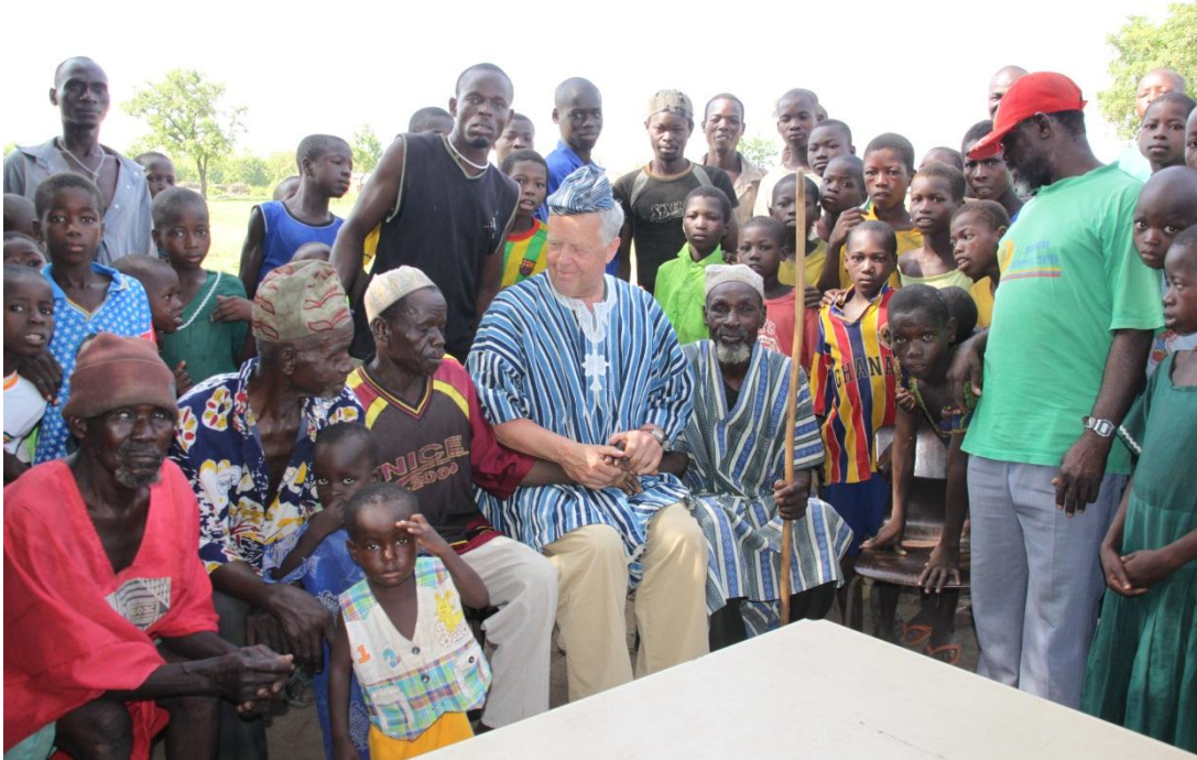
Traditionele kleding cadeau gekregen als dank voor alle hulp die geboden wordt.

Op het gebied van fondsenwerving en donaties zijn wij dankbaar dat wij altijd op uw ruime steun kunnen rekenen. Ook worden er leuke acties op touw gezet zoals 'Proeverij voor het goede doel' op zaterdag 26 oktober 2013 in het cultureel centrum "Kerk aan de Ring" te Hellevoetsluis t.b.v. Stichting Ghana Medical Support en het Restauratiefonds met medewerking van vier gerenommeerde restaurants en de Ierse Folkgroep St. Brandaan . Met grote loterij, diensten- en Kunstveiling. De opbrengst van deze happening zal voor 50% ten goede komen aan Stichting Ghana Medical Support en 50% aan het Restauratiefonds Hellevoetsluis. Zowel de muziekgroep en horeca ondernemers werken belangeloos mee zodat zoveel mogelijk geld ten goede komt aan de projecten. Als u dit bijzondere concert wilt bijwonen bent u van harte welkom en zijn kaarten bij ons verkrijgbaar. De prijs van een toegangskaart bedraagt €30,00 per stuk. Dit is inclusief de hapjes en een welkomstdrankje.