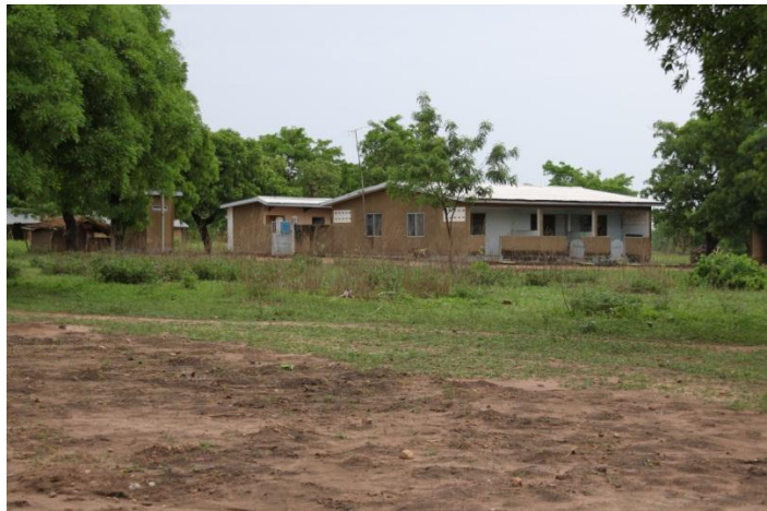
Voorbeeld van onderwijzerswoningen welke we in Tuvuu graag willen bouwen (eerder gebouwd in Yikpabongo).