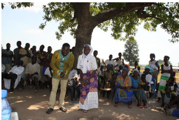
Overleg in één van de dorpen.

In de regio is men blij dat we onze ondersteuning hebben uitgebreid naar meerdere dorpen. Dit voorkomt jaloezie tussen de dorpen onderling. De communicatie tussen ons, chiefs en oudsten gaat steeds beter. Dit komt doordat de studenten die nu goed engels spreken het kunnen vertalen in de Komaland-en de West Mamprusi taal. Wat we ons niet direct hebben gerealiseerd is, dat door de opleiding van de studenten, er soms wel eens fricties zijn met ouders. Het is een generatie kloof en dat zal langzaam moeten slijten. Verder constateren we dat er meer initiatieven worden ontplooid. Zo hebben we het verzoek gekregen van een groep ondernemende vrouwen, die zelf een kleinschalig zeepfabriekje willen exploiteren. We hebben zelfs een goed gedocumenteerd business plan ontvangen. Het plan omvat een investering van GHC 2000,00. Aan eigen inbreng kunnen ze GHC 500,00 opbrengen en vragen daarom een lening van GHC 1.500,00. Omgerekend ca. € 500,00. Ze willen hierdoor meer zelfstandig worden. Wij vinden dat een heel goed initiatief en zullen deze kredietaanvraag honoreren. Natuurlijk wordt hiervoor een leenovereenkomst opgesteld. Het is prima dat er eigen initiatieven worden ontplooid. Dat moeten we blijven bevorderen en ondersteunen.