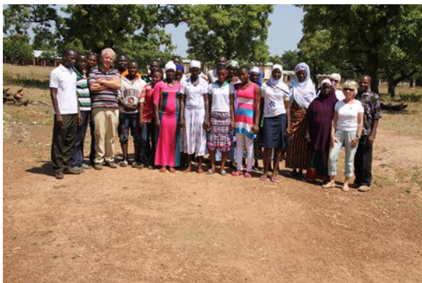
Groepsfoto van de nieuw geselecteerde meisjes met moeders en broers.

Inmiddels zitten de meisjes op scholen, welke ca 100 kilometer verder zijn gelegen. Wij zijn en blijven van mening dat opleiding de sleutel is tot vooruitgang.